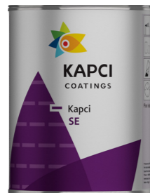
Kapci SE Synthetic enamel