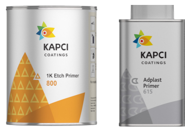
Kapci 800/805/810/820/870/873/875/880 Kapci 615 Adplast Plastic