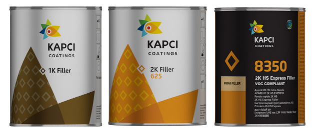
Kapci 625/626/630/633/634/635 Kapci 1K Filler • Prima 8350